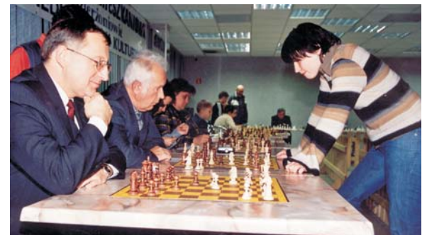
Starosta Dzierżoniowski Zbigniew Rak