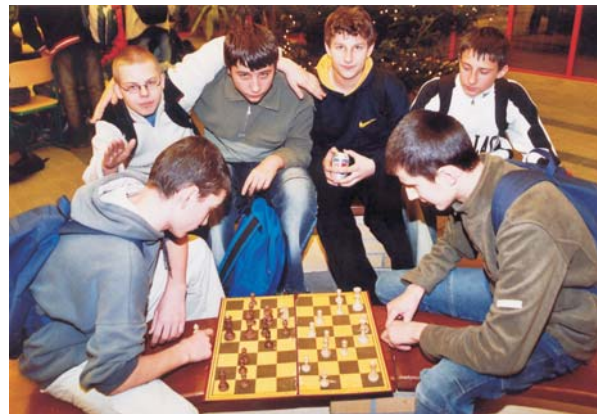
Krotka przerwa w Gimnazjum

Burmistrza Zbigniewa Chlebowskiego (obecnie posła na Sejm), a następnie jego następczyni Burmistrza Lilli Gruntkowskiej istnieje tu bardzo dobry klimat dla szachów. W samym roku 2004 w Żarowie zostało zorganizowanych ponad 20 różnego typu turniejów szachowych, w tym największy i najbardziej znany Nocny Maraton Szachowy BLITZ zorganizowany już po raz 6. Turniej ten, o zasięgu nie tylko krajowym, ale niejednokrotnie z udziałem zawodników zagranicznych i ostatnio obsadą arcymistrzowską, zgromadził w roku ubiegłym rekordową liczbę 132 uczestników. W ubiegłym roku wspólnie z Powiatowym Zrzeszeniem LZS w Świdnicy zostały zorganizowane rozgrywki Powiatowej Ligi Szachowej, w której wystartowało 12 drużyn z terenu powiatu świdnickiego. Na jesieni ub.r. wystartowała już II edycja tym razem Między powiatowej Ligi Szachowej z udziałem 14 drużyn z powiatów: świdnickiego, dzierzoniowskiego i wałbrzyskiego.