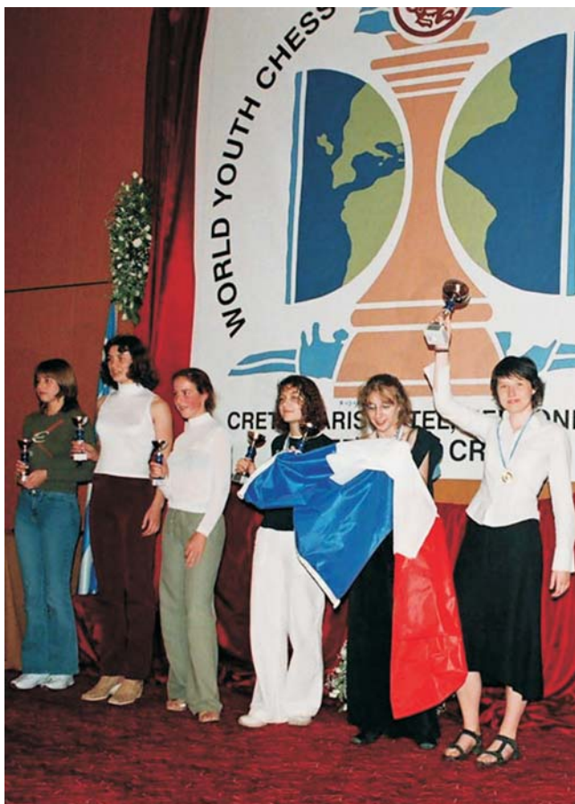
Dekoracja dziewczyn G - 18